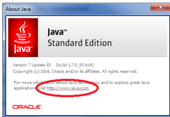
Slika 1: Prozor sa linkom za instalaciju ili ažuriranje